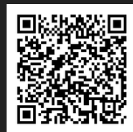
EDREDOM PLUMON FEELING